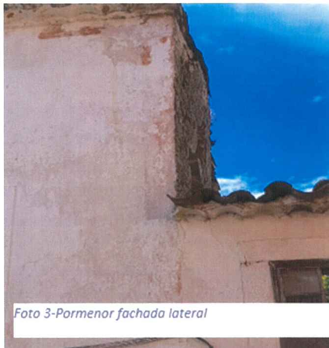
Foto 3-Pormenor fachada lateral