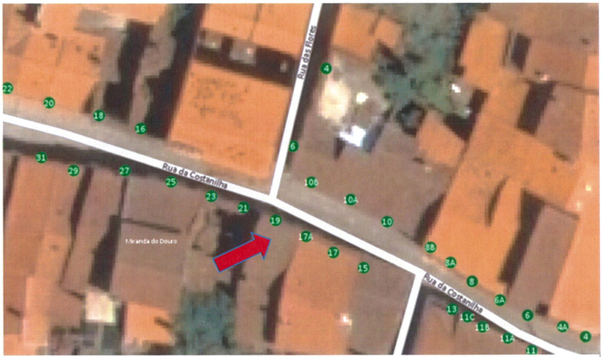
Foto 1-Localização do imóvel