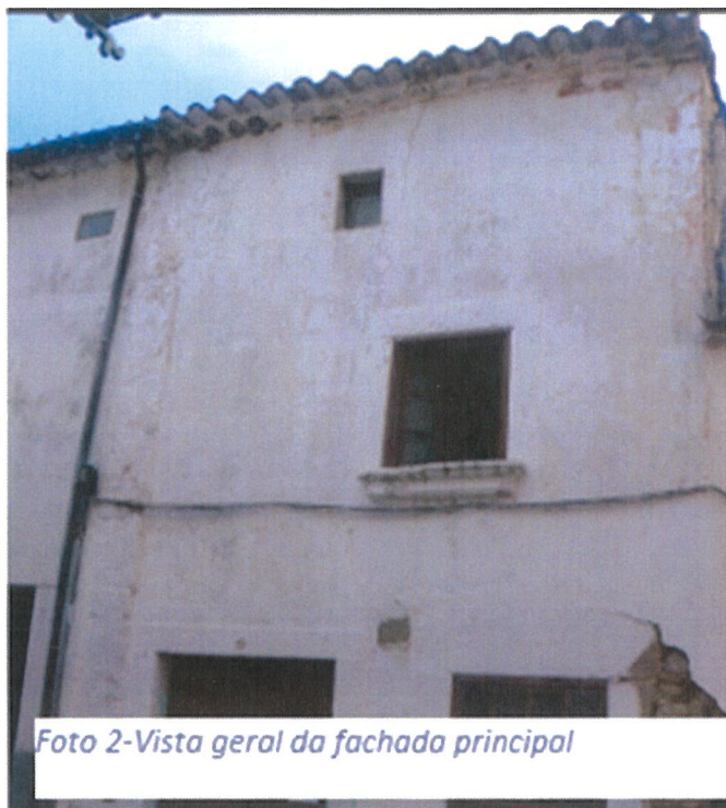
Foto 2-Vista geral da fachada principal