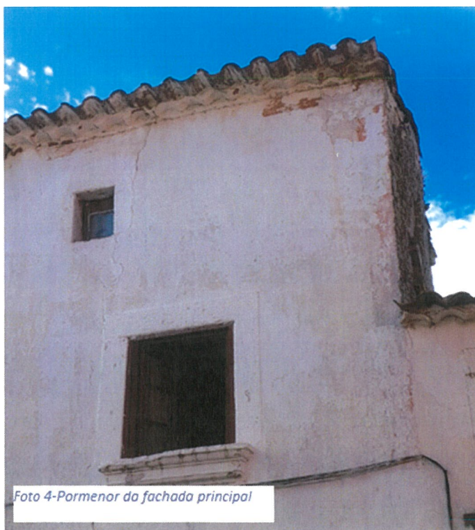
Foto 4-Pormenor da fachada principal