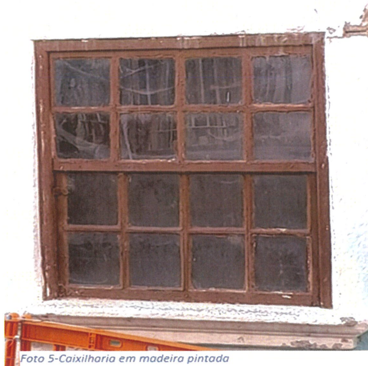
Foto 5-Caixilharia em madeira pintada